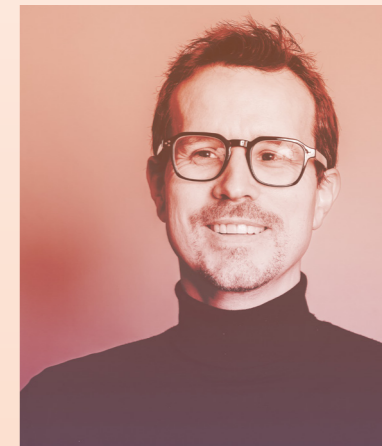
Christophe Blouet ARCHIGROUP

Le rez de chaussée est occupé en quasi-totalité par le stationnement pour libérer un maximum d'espace végétalisé au nord. L'identité de la résidence est marquée par des éléments de résille métallique aux motifs d'inspiration aquatique qui permettent également de préserver l'intimité des terrasses et des habitants.