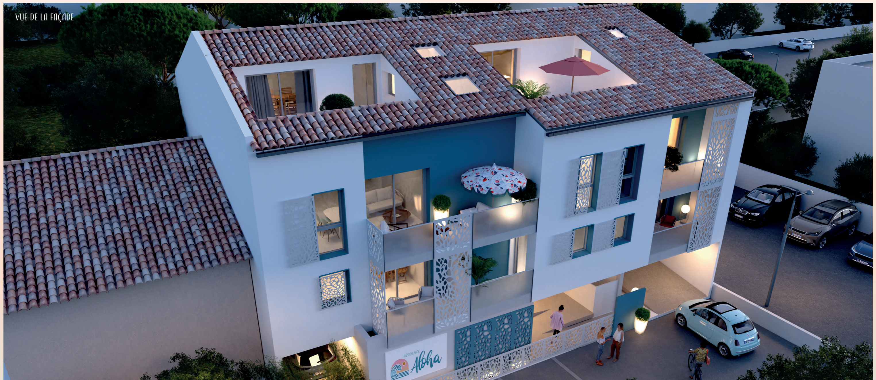
VUE DE LA FAÇADE

Comme une vague qui caresse le rivage, ALOHA insufflé un art de vivre où confort et nature dansent en harmonie. Une résidence pensée pour ceux qui rêvent de lumière, d'évasion et de bien-être, à deux pas de la mer.